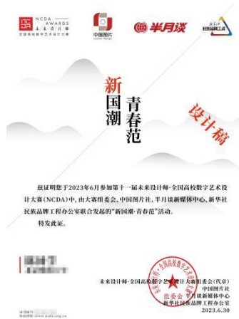
“新国潮·青春范”证书样例