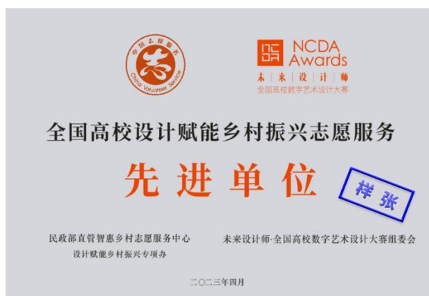
全国高校设计赋能乡村振兴先进单位牌匾